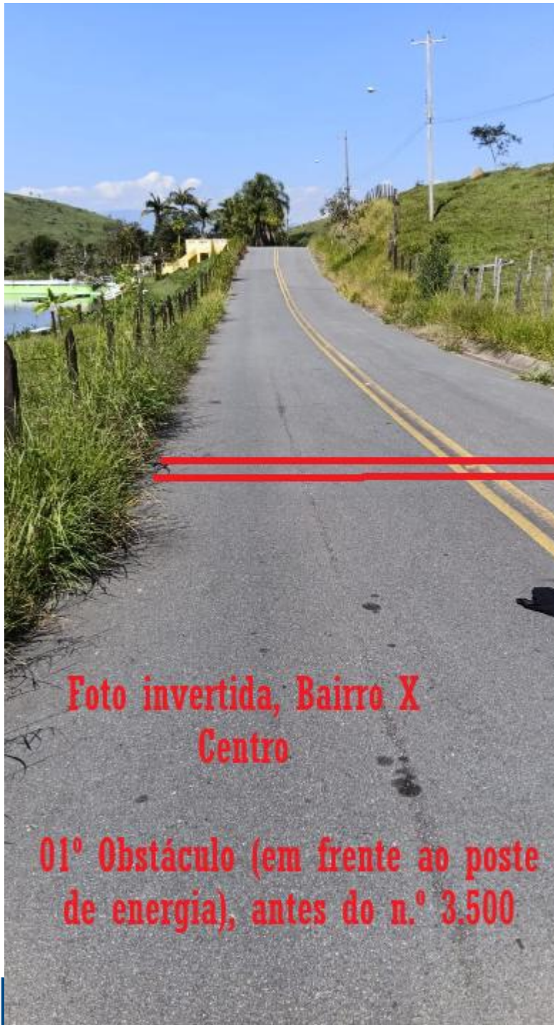
Foto invertida, Bairro X Centro

(foto invertida, no sentido BAIRROxCENTRO, ponto de sugestão de instalação do 01º Obstáculo; perto do lago e em frente a um poste de energia, antes da propriedade de n.º 3.500)